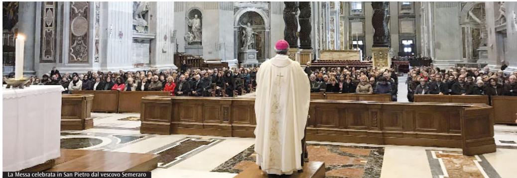
La Messa celebrata in San Pietro dal vescovo Semeraro

Sabato 16 febbraio si è svolta la giornata diocesana degli operatori della Caritas sui passi di Paolo VI