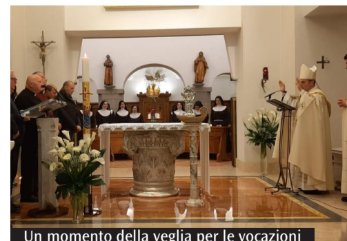
Un momento della veglia per le vocazioni

sta riflettendo su una via di consacrazione, chi si sta già preparando a questo ed è in cammino nel nostro seminario diocesano e in tutte le realtà di vita consacrata della nostra diocesi di Albano». (G.Sal.)