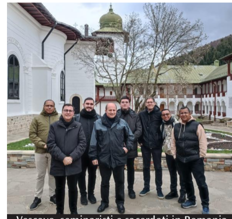
Vescovo, seminaristi e sacerdoti in Romania

Sarà allestita da mercoledì a domenica prossimi, ad Aprilia, presso la sala Manzù della biblioteca comunale, la mostra "Profezie per la pace", organizzata da "Gioventù studentesca" in occasione della 46ª edizione del Meeting per l'amicizia fra i popoli. Si tratta di un percorso in immagini – foto e video – ideato da studenti e docenti di tutta Italia, già presentato al Meeting di Rimini 2025. La mostra gode del patrocinio della diocesi di Albano e della Città di Aprilia. All'inaugurazione, mercoledì 22 aprile alle 18, interverranno il vescovo di Albano Vincenzo Viva, la team partner "Profezie per la pace", Ilara Palumbo, i curatori della mostra e Silvia Guidi, giornalista de L'Osservatore romano. L'ingresso è libero.