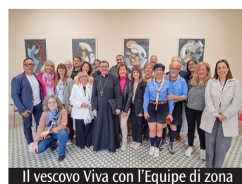
Il vescovo Viva con l'Equipe di zona

e Mare), per essere uno strumento concreto al servizio del territorio, dei parroci e, soprattutto, dei catechisti. L'obiettivo è quello di accorciare le distanze tra l'ufficio e i territori, per offrire un supporto che conosca da vicino le peculiarità e le sfide di ogni singola attività della vasta comunità diocesana. «I membri di questa Equipe - aggiunge il direttore dell'ufficio Catechistico - non sono "professori" in cattedra, ma catechisti tra i catechisti che vivono quotidianamente i limiti e le gioie delle parrocchie. La loro