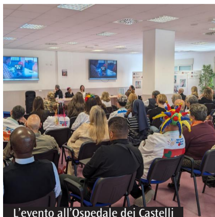
L'evento all'Ospedale dei Castelli

Si conclude oggi, a Genzano di Roma, la 22ª "Infiolata dei ragazzi", appuntamento che anticipa la tradizionale Infiolata, quest'anno giunta alla 248ª edizione e in calendario dal 13 al 15 giugno. Il tema scelto per l'Infiolata dei Ragazzi 2026 è "Inno al Creato: il Cantico delle Creature", un omaggio ispirato a san Francesco d'Assisi, di cui ricorre quest'anno l'ottavo centenario della morte. «Questo tema - si legge in una nota del Comune di Genzano - richiama il cuore del messaggio del santo, fondato sulla pace, sulla fraternità e sull'armonia tra l'uomo, la natura e ogni essere vivente». Il tappeto infiorato su via Bruno Buozzi (già via Sforza) è realizzato dalle alunne e dagli alunni di tutte le scuole della Città e dai membri della Bottega dell'Infiolata, guidati dall'associazione Accademia dei maestri infioratori e dagli insegnanti delle scuole del territorio. A concludere la manifestazione, questa sera, la tradizionale cerimonia dello "spallamento" da parte dei bambini di Genzano di Roma.